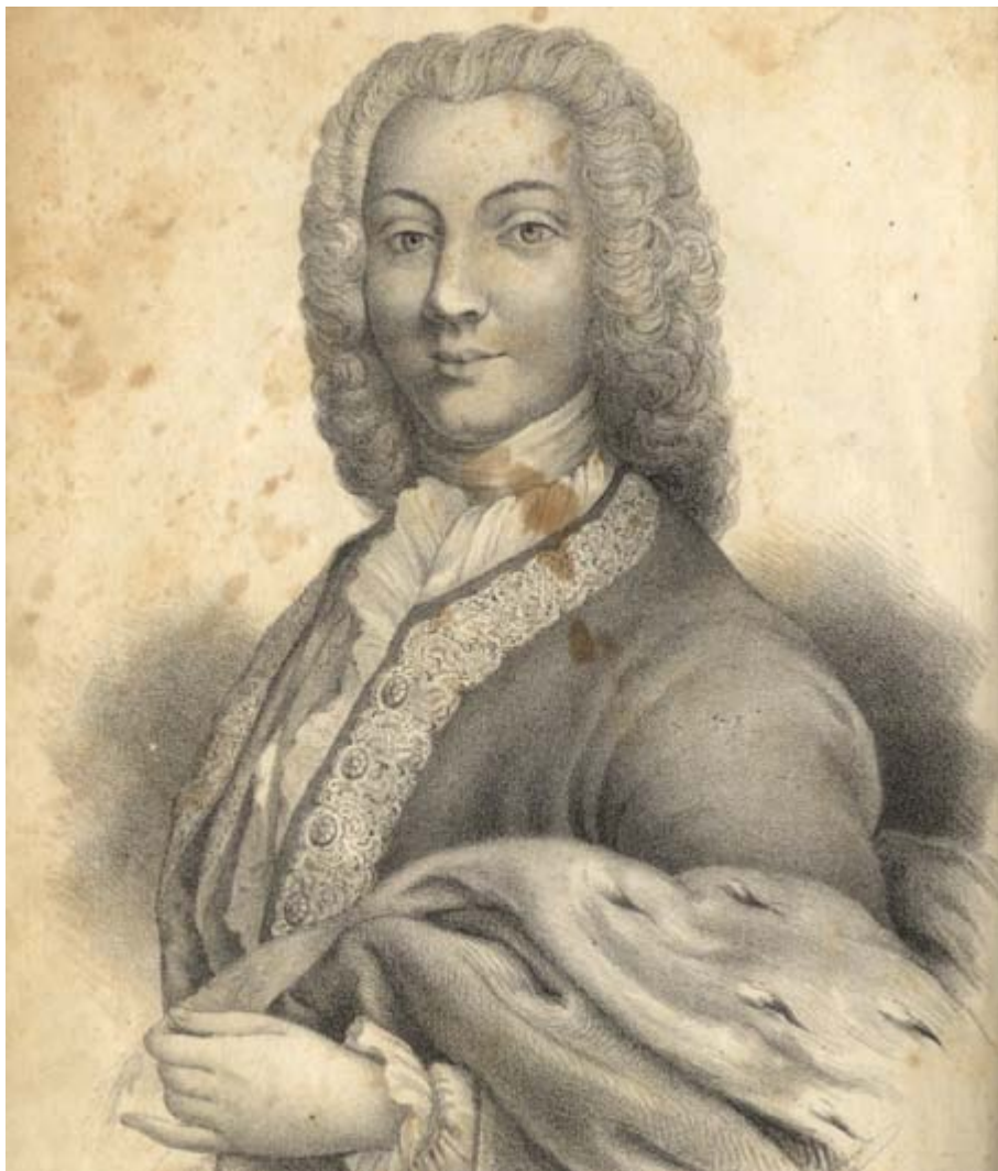
Satire și alte poetice compuneri/de prințul Antioh Cantemir. -Iașii, 1844 Portretul autorului.