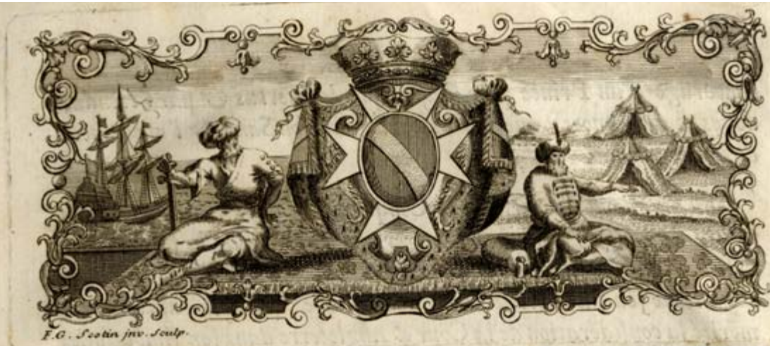
HISTOIRE de l'Empire Othoman... A Paris, M.DCC.XLIII (1743) Frontispiciu cu alegoria Imperiului Otoman.